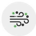
공기질 측정 장치와 무인 방역기를 이용한 공기질 관리 시스템