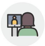
AI기반을 활용한 자동 출결 및 체온 관리 시스템