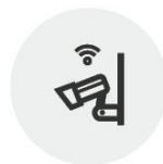
기존 CCTV를 이용하여 영상분석 딥러닝 서버를 통한 학교 폭력 예방 관리 시스템